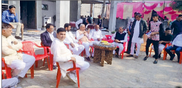
पूर्व कृषि मंत्री जेपी दलाल ने गांव गरवा में विकास कार्यों को लेकर दी जानकारी

बहल। लोगों से बातचीत करते पूर्व मंत्री जेपी दलाल।