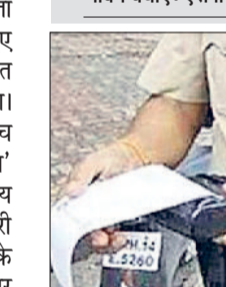
हरिभूमि न्यूज ▶▶ मिवाणी

कोहरे व धुंध में सड़क सुरक्षा एवं ट्रैफिक नियमों का पालन कर खुद व दूसरों का जीवन बचाएं : एसपी